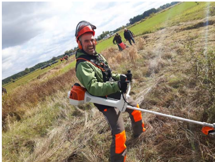
Der Lehrgang zum Geprüften Natur- und Landschaftspfleger/zur Geprüften Natur- und Landschaftspflegerin startet im September 2022.

In Theorie und Praxis sowie in vielen Exkursionen lernen die Teilnehmerinnen und Teilnehmer unter anderem die Grundlagen des Naturschutzes und der Landschaftspflege, Umweltbildung und Öffentlichkeitsarbeit, aber auch Grundsätze des Gewerbe- und Steuerrechts oder des Arbeits- und Sozialrechts. Schwerpunkte bilden zudem der Einsatz von Maschinen und Geräten in der Landschaftspflege, die fachgerechte Pflanzung und Pflege von Hecken und Gehölzen, naturschutzfachliche Grundlagen sowie Umweltpädagogik.