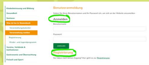
Anmelden oder neu registrieren und Benutzerprofil erstellen