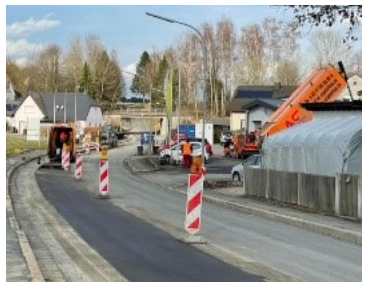
Die 20 kV-Kabelverlegung durch das Bayernwerk geht voran.

Und mit dem neuen Fahrradweg von Stammbach nach Gundlitz geht es auch bald los. Ebenso mit dem Abriss und der Neugestaltung des Anwesens Rathausstraße 8. Infos und Pläne zu allen Maßnahmen finden Sie auf der Homepage www.stammbach.de .