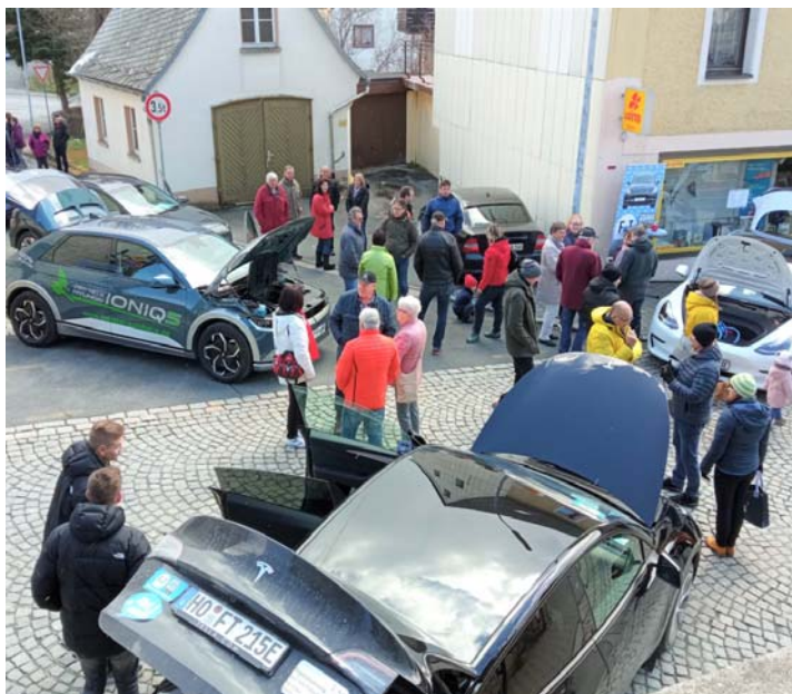
Anziehungspunkt war die E-Automobil-Ausstellung.