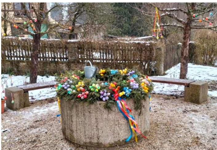
Osterbrunnen in Förstenreuth