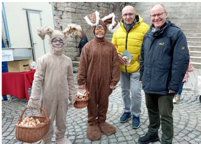
Die Osterhasen verteilten süße Geschenke an die Kinder.