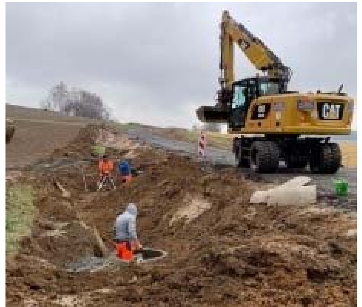
Der Neubau der Verbindungsstraße Förstenreuth-Weickenreuth macht große Fortschritte. Eine Großbaustelle mit 1,5 Mio Euro Volumen.