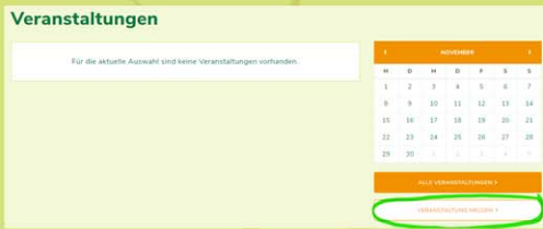
Auf www.stammbach.de - Startseite zu „Veranstaltungen“ scrollen

Schauen Sie doch einfach auf der Homepage vorbei und Ihre Veranstaltungen erscheinen auf www.stammbach.de und im Mitteilungsblatt!