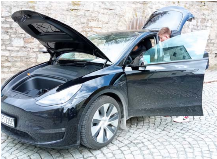
Die E-Autos konnten besichtigt werden.