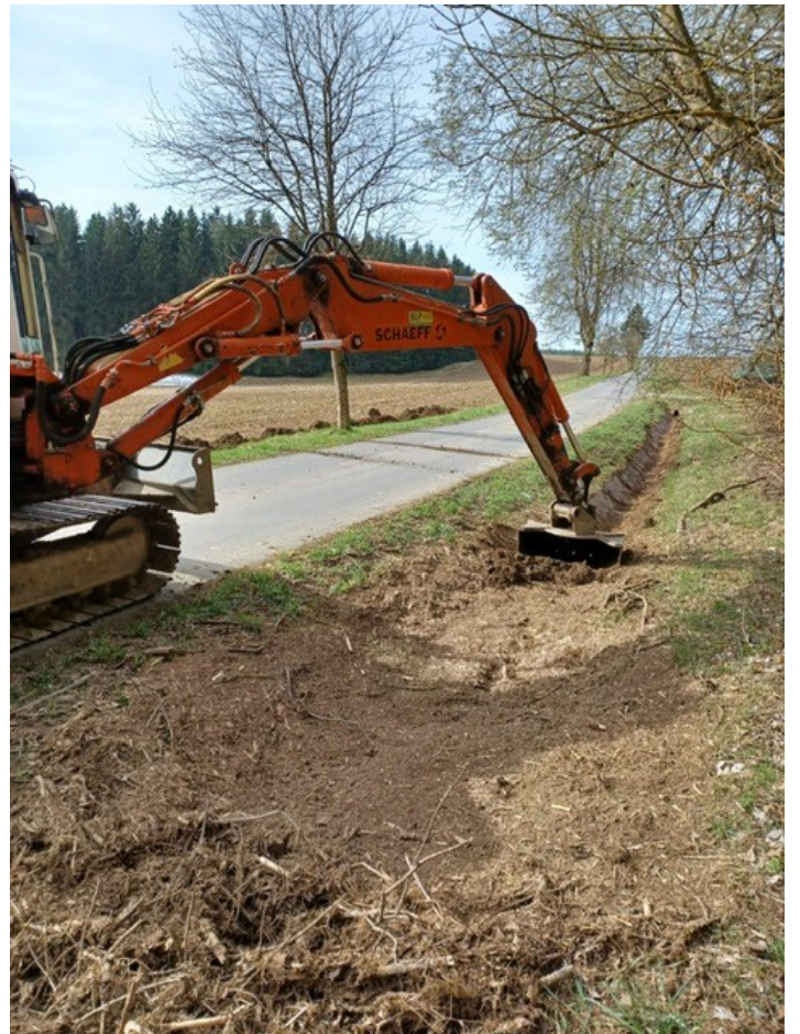
Nach dem Unwetter bei der Kropfmühle wurde der Graben geräumt.