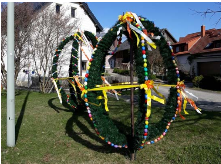
Ostern in Gundlitz