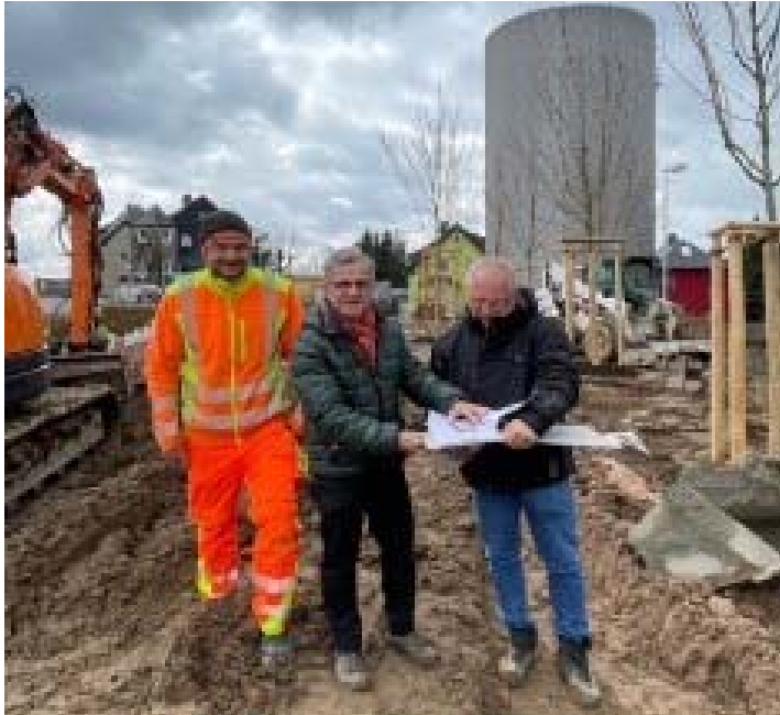
Auf der Baustelle Weißensteinstraße wurden Bäume gepflanzt.

Im April war ganz schön was los. Mit den Baustellen geht es gut voran.