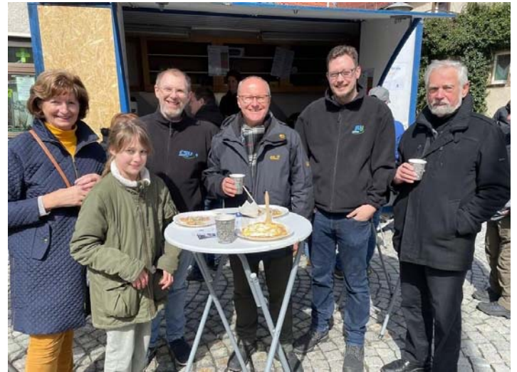
Man ließ sich Kaffee und Kuchen schmecken.