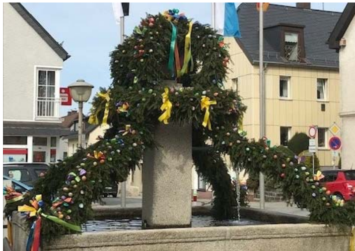
Der Stambacher Osterbrunnen.