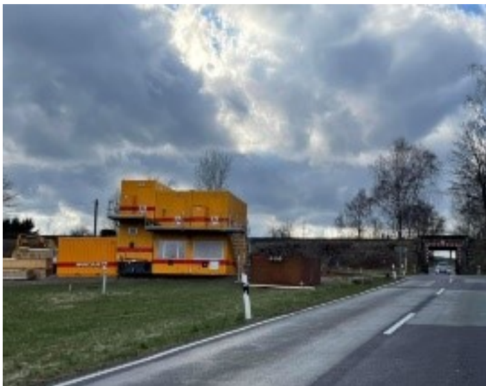
Die Baustelleneinrichtung für den Neubau der Bahnbrücke bei Metzlesdorf ist abgeschlossen.